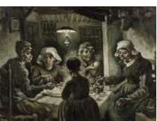
Вінсент ван Гог «Їдці картоплі»