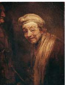
Рембрандт «Автопортрет в образі Зевксіса, який сміється»

5 Відшукай три килимки, на яких Андрій Сагайдаковський по-своєму зображає твори інших художників. Зверни увагу, у чому схожість, а в чому — відмінність? Запиши назви робіт Сагайдаковського поруч із творами інших художників, якими він надихнувся: