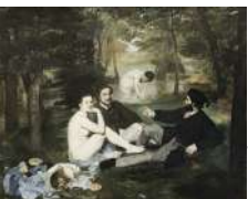
Едуард Мане «Сніданок на траві»