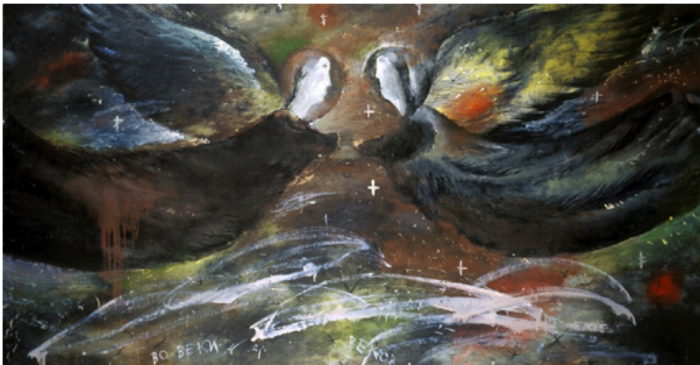
Патетична ангеліада. 1988 р.

«Сказати, що Олег був незвичайною людиною — не сказати нічого. Це була екстраординарна особистість.. Йому була властива спонтанність, одночасне перебування в спокої і в бентежному русі. Для нього була звичною ситуація проходити повз вокзальних кас і сісти на потяг в будь-якому напрямку», — згадує Валерія Трубіна. Свої взаємовідносини з Голосієм вона порівнює з космічним явищем, де в їхній бінарній системі Олег був зіркою, що оберталась з більшою швидкістю, а його внутрішній енергетичний потік був значно інтенсивнішим, ніж у всіх з їхнього оточення.