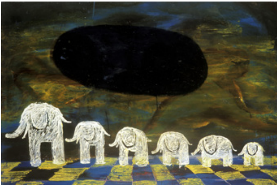
Шість слоників. 1991 р.

Олег Голосій експериментував зі стилями, але його вектор руху лишався незмінним. Навіть розуміючи, що нові медіа заповняють світ мистецтва, Голосій залишається вірним живопису до кінця. «Можливо, через секунду, це вже буде весело», — коментує Голосій «смерть» живопису.