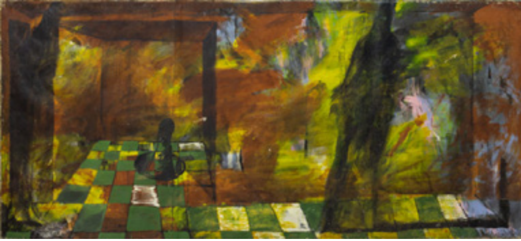
Вибухова хвиля жовтої кімнати. 1990 р.